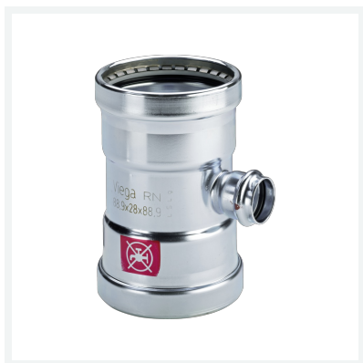
Prestabo XL-T-Stück mit SC-Contur Modell 1118XL Artikel 597 849