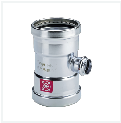
Prestabo XL-T-Stück mit SC-Contur Modell 1118XL Artikel 597 917