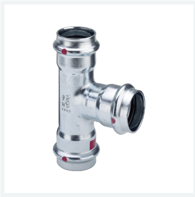
Prestabo-T-Stück mit SC-Contur Modell 1118 Artikel 642 648