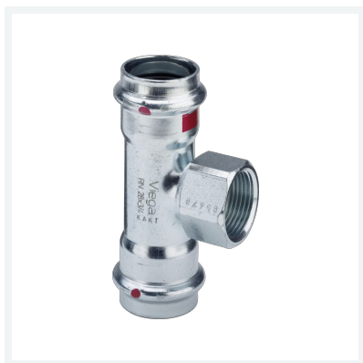
Prestabo-T-Stück mit SC-Contur Modell 1117.2 Artikel 558 987