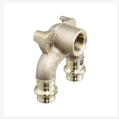
Sanpress-Doppelwandscheibe mit SC-Contur Modell 2228.7 Artikel 687 892