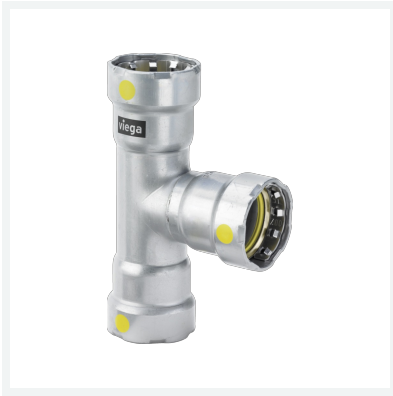
Megapress G-T-Stück mit SC-Contur Modell 4618 Artikel 739 638