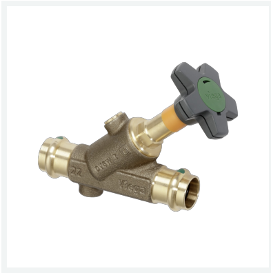
Easytop-Schrägsitzventil (Freistromventil) mit SC-Contur Modell 2237.5 Artikel 756 888