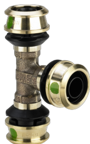
Raxofix-T-Stück mit SC-Contur - Pressanschlüsse Modell 5318