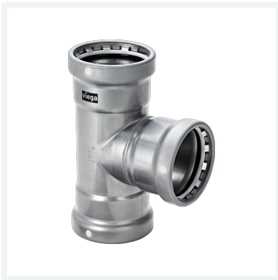
Megapress S XL-T-Stück mit SC-Contur Modell 4218XL Artikel 752 019