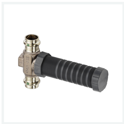
Easytop-UP-Geradsitzventil mit SC-Contur Modell 2235.2 Artikel 755 591