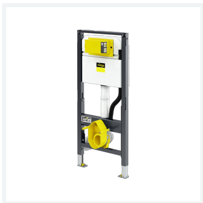
Prevista Dry-WC-Element Keramikhöhe verstellbar mit Dusch-WC-Anschluss 1120 mm Modell 8521 Artikel 771 997