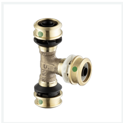
Raxofix DN10-T-Stück mit SC-Contur Modell 5318.01 Artikel 781 958