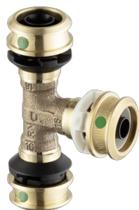
Raxofix DN10-T-Stück mit SC-Contur - Pressanschlüsse Modell 5318.01