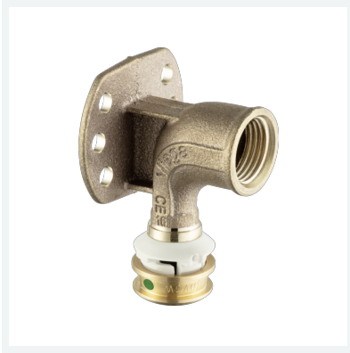
Raxofix DN10-Wandscheibe mit SC-Contur Modell 5325.51 Artikel 781 491