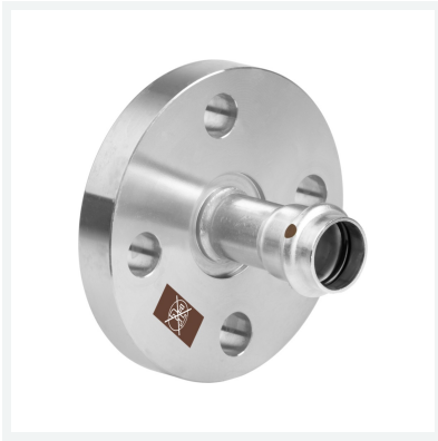
Temponox-Flanschübergang mit SC-Contur Modell 1759.1 Artikel 811 211