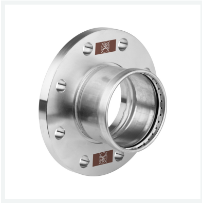
Temponox XL-Flanschübergang mit SC-Contur Modell 1759XL Artikel 811 174