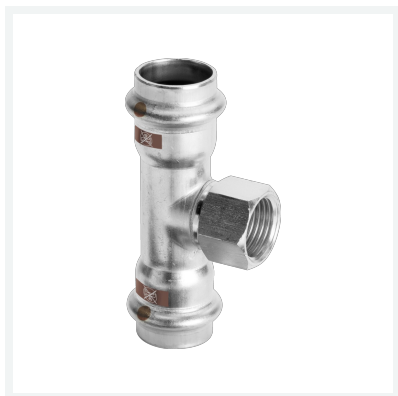
Temponox-T-Stück mit SC-Contur Modell 1717.2 Artikel 810 887