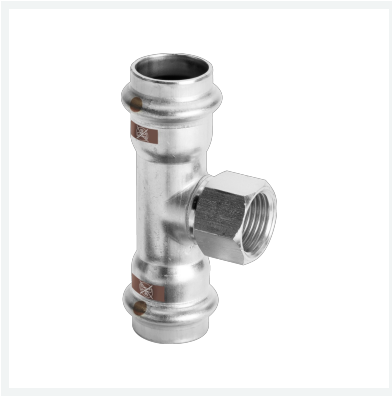
Temponox-T-Stück mit SC-Contur Modell 1717.2 Artikel 810 917