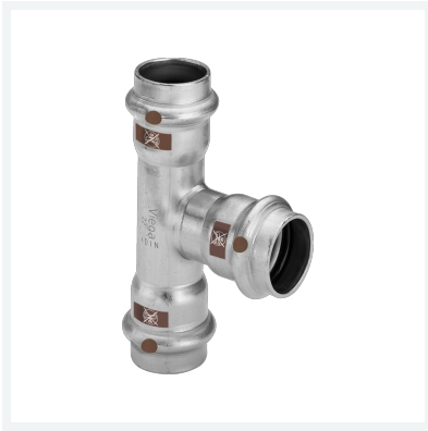
Temponox-T-Stück mit SC-Contur Modell 1718 Artikel 810 177