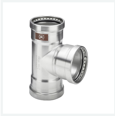
Temponox XL-T-Stück mit SC-Contur Modell 1718XL Artikel 810 696